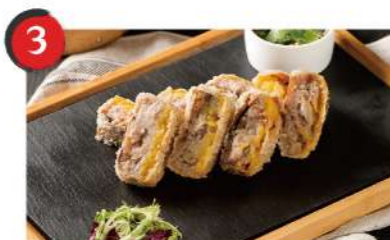
3 香酥芋金鴨 $360