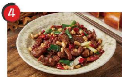
4 醉仙牛肉 $330