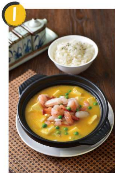
1 蟹黃海鮮豆腐煲 $250