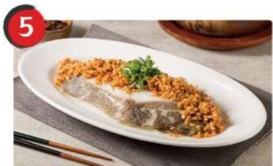
5 豆酥鱈魚 $410