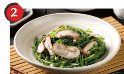
2 清炒野水蓮 $200